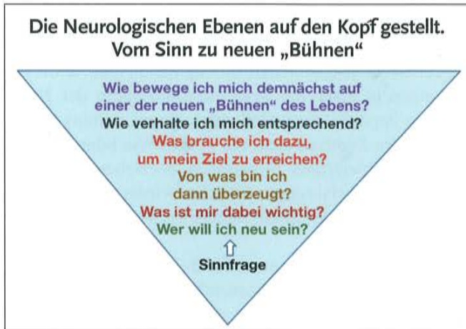
Neurologische Ebenen auf dem Kopf

Ich nutze noch eine weitere Metapher für meine Arbeit: die Theatermetapher von Bernd Schmid. Sie zeigt, auf welchen „Bühnen“ des Lebens und in welchen Rollen Betroffene unterwegs sind oder sein wollen. Diese Metapher lässt neue Gedankenspiele für die Zukunft zu. Wenn Peter seinem Leben einen neuen Sinn gibt und bereit ist, es mehr und mehr selbst zu steuern, dann ergeben sich folgende Fragen: